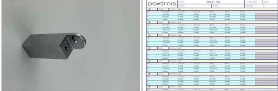
5. Product: 6. Report: