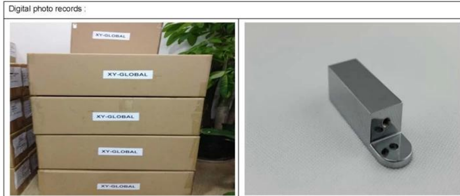
1. Packing 2. Product